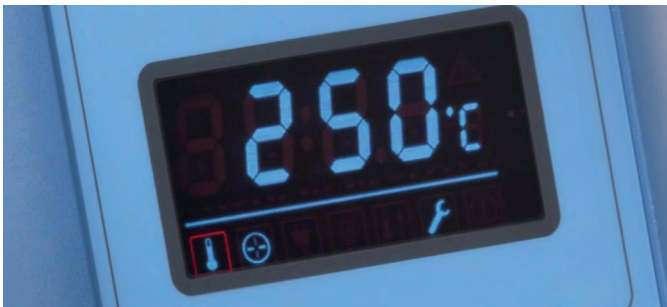
Affichage fluorescent à vide très lisible avec boutons tactiles simples à utiliser

Les étuves Thermo Scientific Heratherm grande capacité permettent de réaliser des économies d'énergie de 25 % par rapport aux étuves classiques*