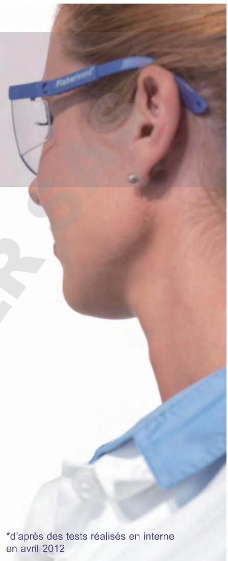
*d'après des tests réalisés en interne en avril 2012