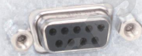
Port RS232 standard sur tous les modèles / tailles GP, AP et APS

Les incubateurs Heratherm disposent des meilleurs systèmes de surveillance des données, atouts essentiels pour des résultats fiables