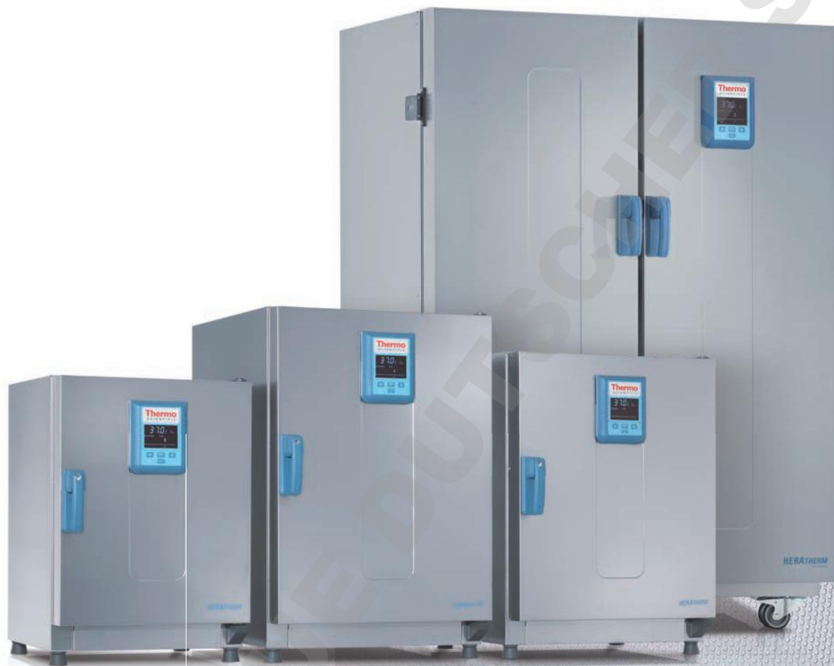
Incubateurs microbiologiques Heratherm Advanced Protocol Security avec extérieur en acier inoxydable

Un extérieur en acier inoxydable est disponible en option pour les modèles Advanced Protocol et Advanced Protocol Security.