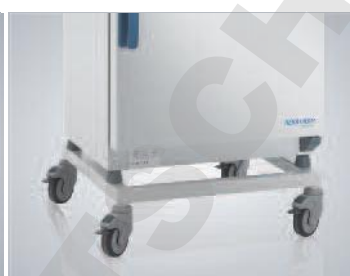
Piètement avec roulettes