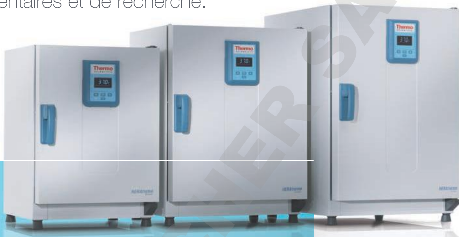
Étuves Heratherm General Protocol, 60 L, 100 L, 180 L

Conçus pour les applications de routine des laboratoires pharmaceutiques, médicaux, alimentaires et de recherche.