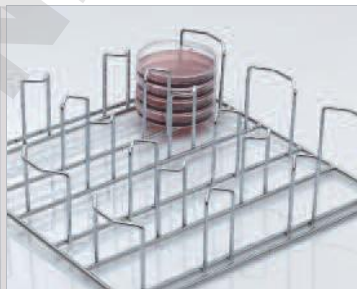
Étagère pour boîtes de Petri