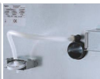
Filtre à particules