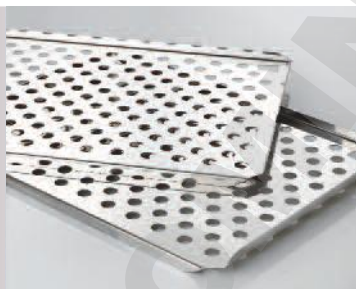
Étagères perforées en acier inoxydable