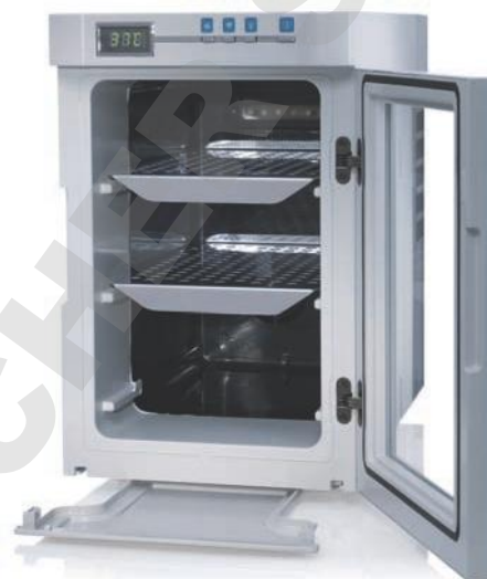
Incubateur microbiologique Heratherm Compact, 18 L