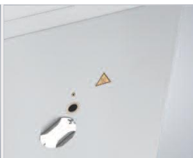
Port d'accès du côté droit