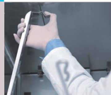
TABLEAU DES CARACTÉRISTIQUES/RÉFÉRENCES INCUBATEURS GENERAL PROTOCOL