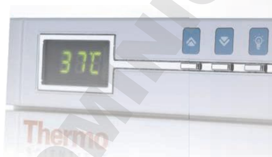
TABLEAU DES CARACTÉRISTIQUES/RÉFÉRENCES INCUBATEURS COMPACT