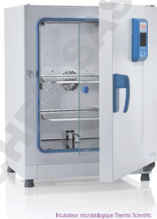
Incubateur microbiologique Thermo Scientific Heratherm Advanced Protocol avec système exclusif de convection double