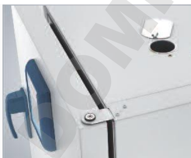
Port d'accès de la face supérieure