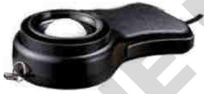
Capteur photo étroit Ø 23 mm Précision de la source lumineuse