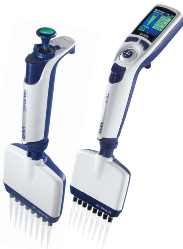
Modelli Pipet-Lite XLS+ e E4 XLS+

Le pipette elettroniche multicannale E4 XLS+ Rainin consentono di lavorare con le piastre in modo più rapido. Le modalità special velocizzano il trasferimento di più aliquote, ottimizzano l'esecuzione di diluizioni in serie e consentono di pianificare una serie di trasferimenti in tempi più brevi.