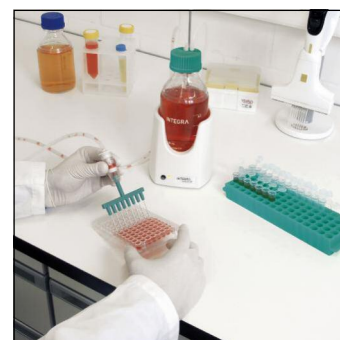
Élimination de solutions de lavage