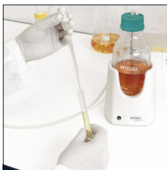
Élimination du surnageant lors de la récolte de bactéries