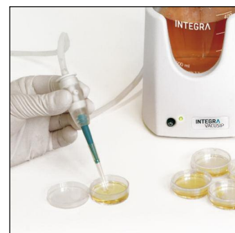
Aspiration de milieux de culture