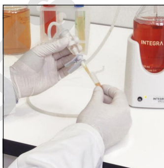
Aspiration de surnageants