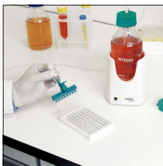
Aspiration de bandes Western blot