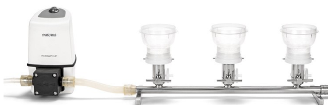
Rampe Microsart® avec Microsart®@filter et pompe Microsart® e.jet (La pompe et les unités de filtration ne sont pas incluses dans le contenu de la livraison)