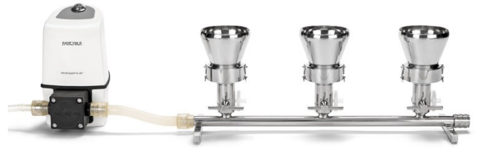
Rampe Microsart® avec entonnoirs en acier inoxydable 100 ml et pompe Microsart® e.jet (La pompe n'est pas incluse dans le contenu de la livraison)