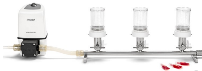
Rampe Microsart® avec systèmes Biosart® 100 et pompe Microsart® e.jet (La pompe et les moniteurs ne sont pas inclus dans le contenu de la livraison)