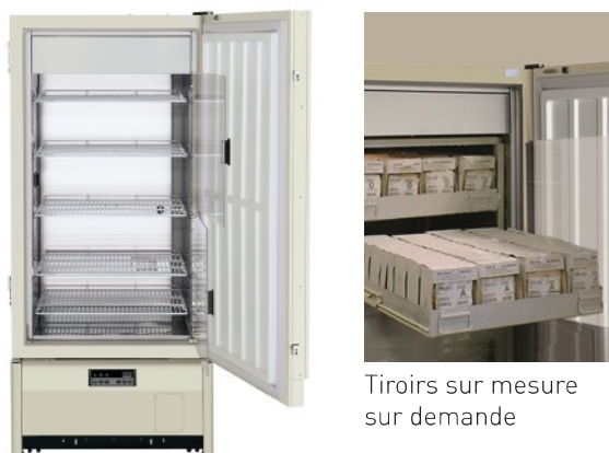
Tiroirs sur mesure sur demande