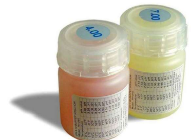
Solutions d'étalonnage pH4 et pH7