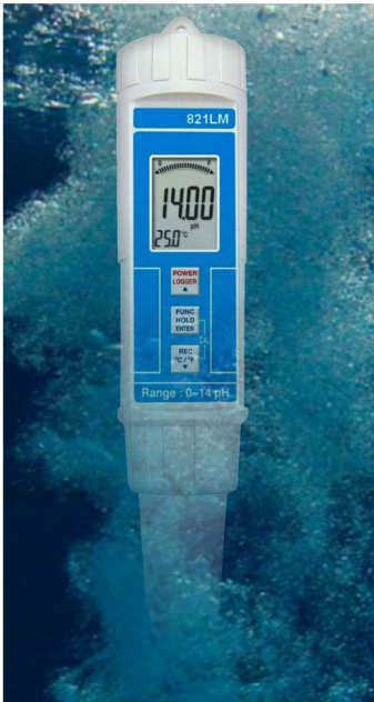
Étanche immersion IP 67