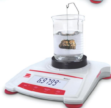
Scout illustrée avec le kit de détermination de densité en option