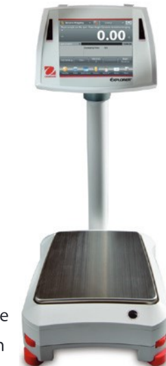
Présentée avec montage sur colonne en option