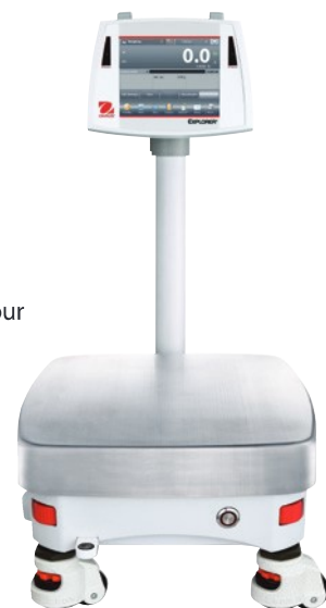
Exposées avec les options colonne et pieds réglables