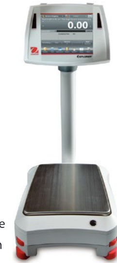
Présentée avec montage sur colonne en option