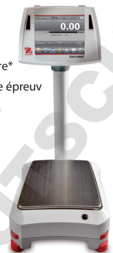
Présentée avec montage sur colonne en option