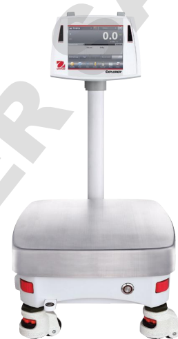
Exposées avec les options colonne et pieds réglables

La batterie rechargeable en option assure 10 heures de fonctionnement hors alimentation secteur