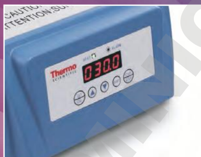
Bain à sec/Bloc chauffant numérique p. 3

Une fiabilité sur laquelle vous pouvez compter. Les bains à sec et blocs chauffants Thermo Scientific™ polyvalents se déclinent en une vaste gamme de blocs pouvant accueillir différents tubes. Disponibles avec des commandes d'écran numériques ou tactiles, nos unités assurent une uniformité et une stabilité de température hors pair qui vous aident à obtenir les résultats reproductibles recherchés.