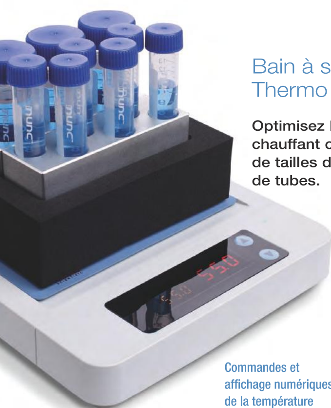
Commandes et affichage numériques de la température