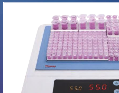
Bain à sec/Bloc chauffant compact p. 6