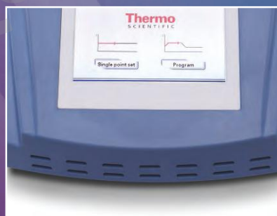
Bain à sec/Tactile chauffant à écran tactile p. 4