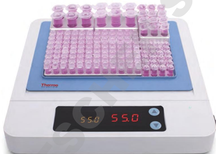
Faible encombrement Poids et

Optimisez l'espace de la paillasse avec notre bain à sec/bloc chauffant compact et léger, disponible en plusieurs combinaisons de tailles de bloc pour plus de polyvalence en matière de tailles de tubes.