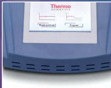
Bain à sec/Tactile chauffant à écran tactile p. 4