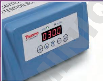
Bain à sec/Bloc chauffant numérique p. 3

nos unités assurent une uniformité et une stabilité de température hors pair qui vous aident à obtenir les résultats reproductibles recherchés.