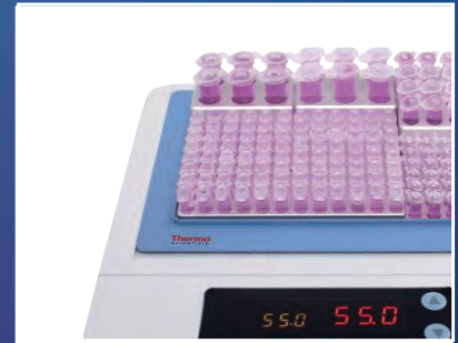
Bain à sec/Bloc chauffant compact p. 6