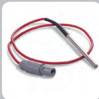
Sonde de température PT 1000 en option

Informations de commande et caractéristiques*