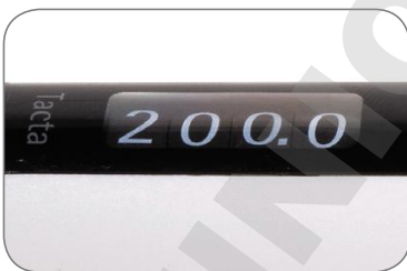
La lecture du volume reste facile, même si la pipette est inclinée.

L'affichage large facilite la lecture des quatre chiffres du volume, même à distance, sans fatiguer vos yeux. Il est facile de vérifier le volume même si la pipette est inclinée – vous évitant ainsi de tourner la tête et d'adopter une position inconfortable.