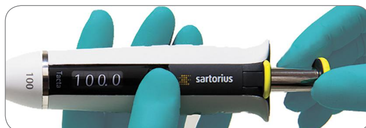
Réglage du volume