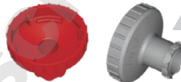
Adaptateur pour Ritips® 25 ml Adattatore per Ritips® 25 ml