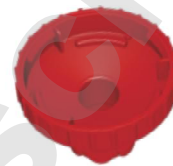
Adapter: Ritips® 25 ml

La serie clásica de puntas de dosificación A série clássica de ponteiros de dosagem