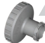
Adapter: Ritips® 50 ml