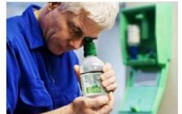
Vous pouvez aussi pencher la tête en avant pour éviter de mouiller vos habits