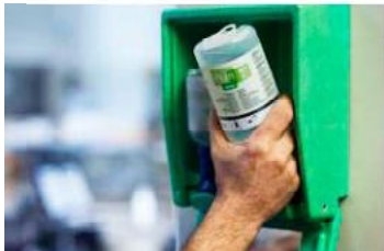
Enlevez le flacon de la station