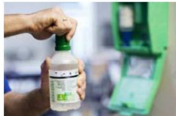
Dévissez l'ocillère jusqu'à casser l'opercule