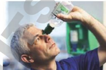
Penchez la tête en arrière puis rincez