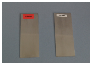
après immersion dans la solution after immersion in the solution

Étiquette rouge (à gauche) : FORMULE 2419 Étiquette blanche (à droite) : eau déminéralisée