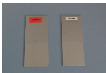
avant immersion dans la solution before immersion in the solution