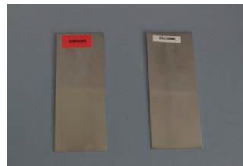
après immersion dans la solution after immersion in the solution

Étiquette rouge (à gauche) : FORMULE 2419