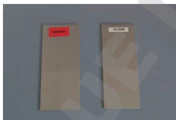
avant immersion dans la solution before immersion in the solution