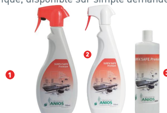
FR2419-160909-Photos non contactuelles

*Le Robert Koch Institute recommande l'utilisation de désinfectants avec la revendication "begrenzt viruzid wirksan", soit activité virucide limitée, pour interrompre la chaîne de transmission. Selon cet Institut, l'activité virucide limitée correspond à une activité sur virus de la vaccine et BVDV. L'ensemble des activités antimicrobiennes du produit est inclus dans le dossier scientifique, disponible sur simple demande.