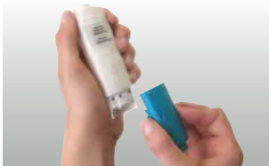
Echange simplifié de l'électrode sur les testo 206-ph 1/-ph 2/-ph 3