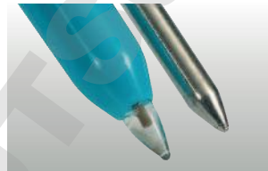
testo 206-pH2: Electrode pH 2 pour milieu pâteux avec capot de stockage