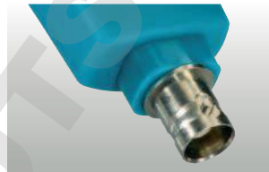
testo 206-pH3: Electrode pH 3 avec interface BNC