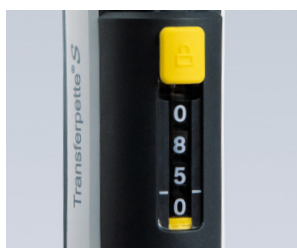
Protection du réglage de volume