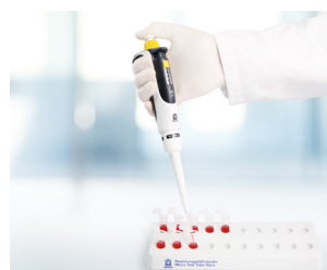
Préparation des échantillons