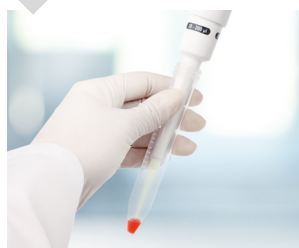
Tubes à centrifuger étroits

Les portes-cônes individuels et les joints sont faciles à dévisser et peuvent ainsi être nettoyés ou remplacés en toute facilité