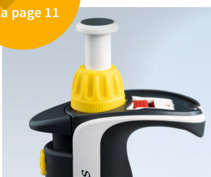
Technique Easy Calibration