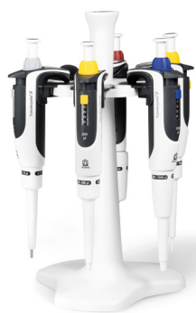
Fig. Kit de pipettes 2