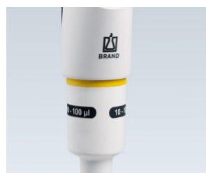
Connexion partie haute