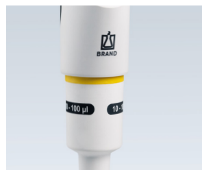
Connexion partie haute