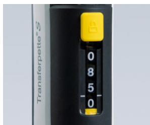
Protection du réglage de volume