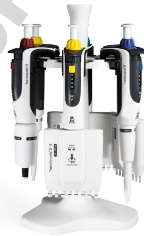
Tischständer Tischständer für 6 Transferpette® S Ein- oder Mehrkanalpipetten.