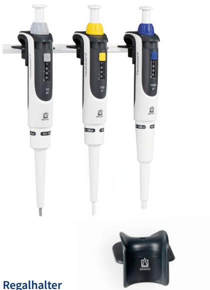
Regalhalter für 1 Transferpette® S Ein- oder Mehrkanalpipette.

Mit den Haltern und Ständern sind die Geräte immer fachgerecht aufbewahrt und griffbereit für den nächsten Einsatz.