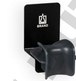
Wandhalter für 1 Transferpette® S Ein- oder Mehrkanalpipette.