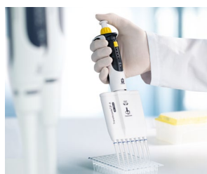
Arbeiten mit PCR-Platten