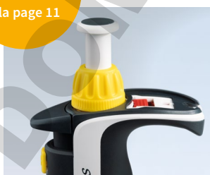
Technique Easy Calibration