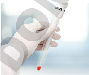
Tubes à centrifuger étroits