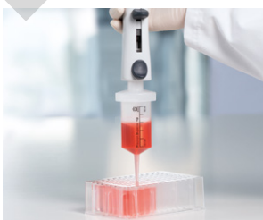
Distribution à répétition