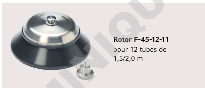
Rotor F-45-12-11 pour 12 tubes de 1,5/2,0 ml