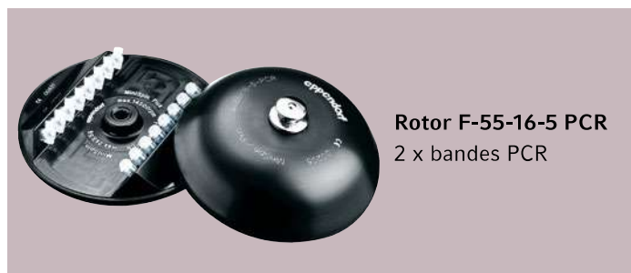
Rotor F-55-16-5 PCR 2 x bandes PCR