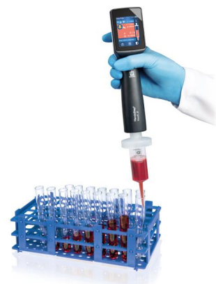
Dosage séquentiel avec HandyStep® touch S et pointe DD tip //