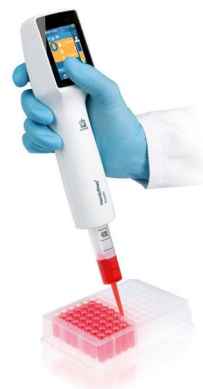
Multi-dosage avec HandyStep® touch et pointe DD tip //

Le HandyStep® touch permet d'économiser du temps et évite les erreurs grâce à la reconnaissance automatique de la taille des pointes DD tips // de BRAND avec codage breveté sur le piston. Après l'insertion, la taille de pointe détectée est affichée automatiquement. Vous pouvez désormais sélectionner le volume à doser rapidement et en toute facilité. Le réglage de l'appareil reste conservé lors de l'insertion d'une nouvelle pointe DD tip de même taille.