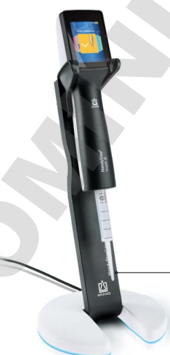
Support de chargement avec HandyStep® touch S et pointe DD tip //

En plus des pointes DD tips de BRAND, vous pouvez aussi utiliser les pointes compatibles d'autres fabricants