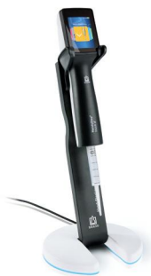
Support de chargement avec HandyStep® touch S et pointe DD tip //