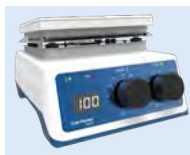
plaque chauffante UC152D