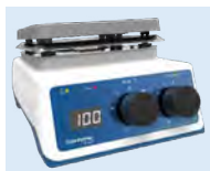
plaque chauffante US152D

Surveillez de près vos paramètres. L'affichage numérique indique clairement la température de la plaque chauffante en service.