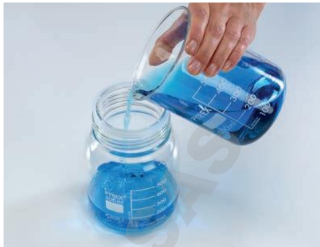
Remplissage aisé, sans entonnoir

Vous pouvez consulter www.fr.scilabware.com et entrer le code de traçabilité pour télécharger un certificat de lot spécifique à tout moment et aussi souvent que nécessaire.