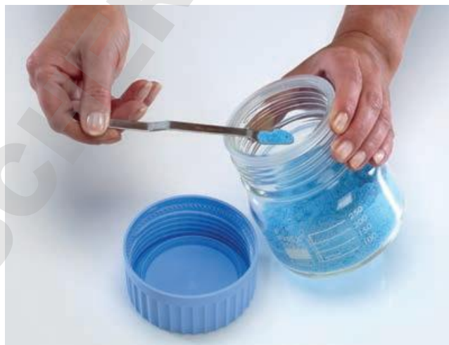
Facilité d'accès pour les pinces, spatules et cuillères