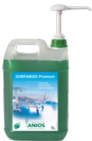
Surfanios Premium Bidon de 5L